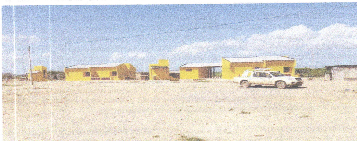
Fotografía 1. Panorámica de la fachada de las viviendas. A lado izquierdo de cada una se ubican los baños.

Las siguientes fotografías ilustran el modelo de las viviendas y el estado avance de las construcciones: