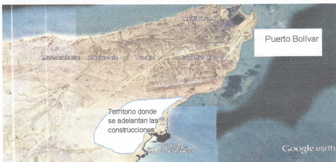
Figura. Ilustración del sitio donde se adelanta la construcción de las viviendas por parte de la empresa VANFER & CIA

En el recorrido se llegó al lugar donde se construye la vivienda a entregar a la señora OSIRIS EPIEYU, la cual se ubica aproximadamente en las coordenadas (X 1227310 – Y 1847735). La siguiente figura ilustra el sitio donde se adelanta el proyecto completo de viviendas: