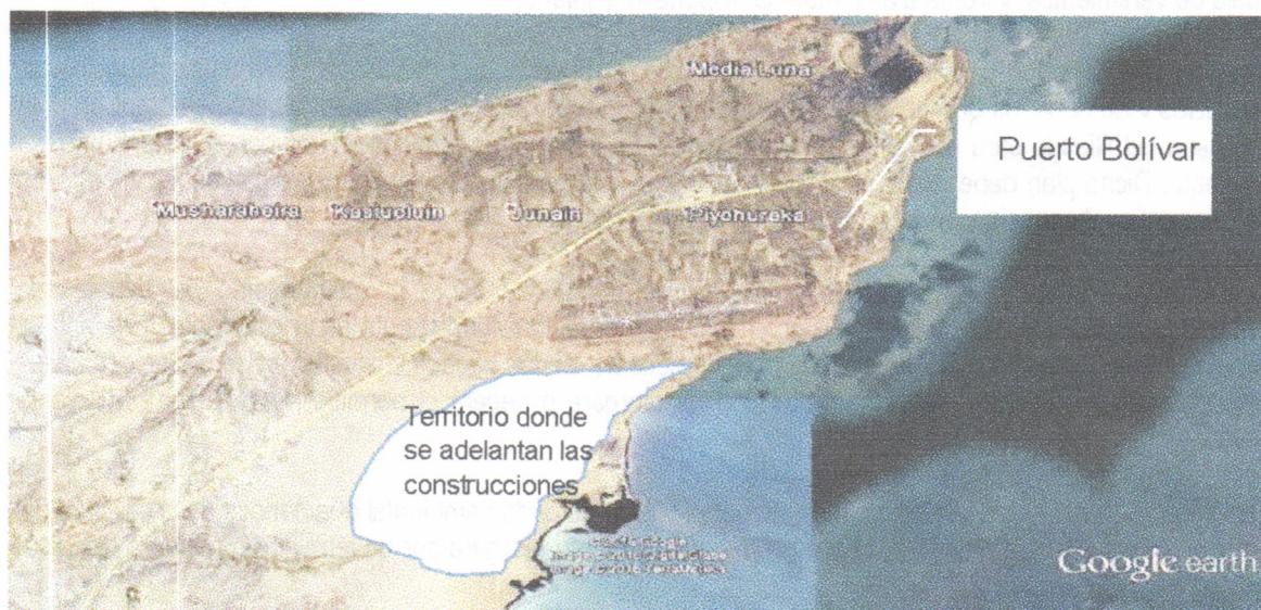
Figura. Ilustración del sitio donde se adelanta la construcción de las viviendas por parte de la empresa VANFER & CIA

En el recorrido se llegó al lugar donde se construye la vivienda a entregar a la señora BASILIA EPINAYU, la cual se ubica aproximadamente en las coordenadas (X 1229066 – Y 1844111). La siguiente figura ilustra el sitio donde se adelanta el proyecto completo de viviendas: