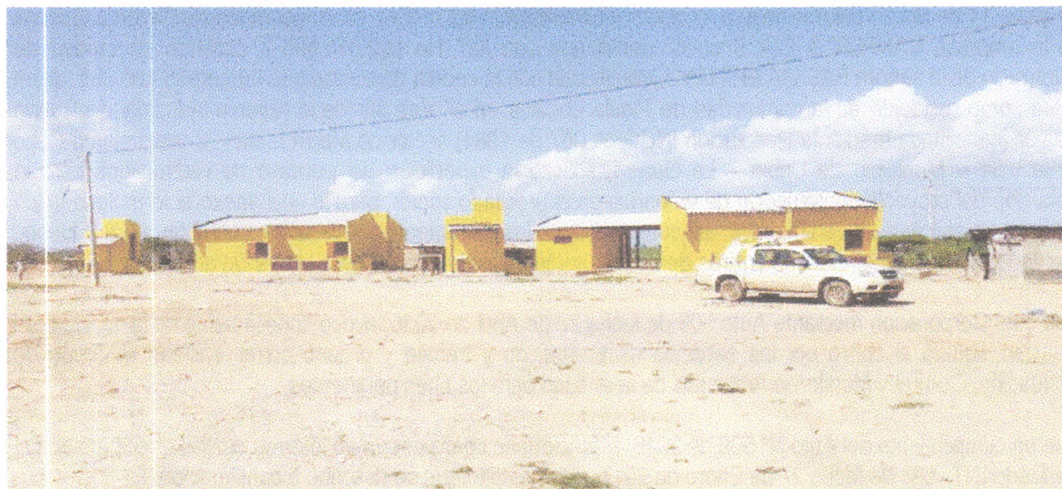
Fotografía 1. Panorámica de la fachada de las viviendas. A lado izquierdo de cada una se ubican los baños.

Las siguientes fotografías ilustran el modelo de las viviendas y el estado avance de las construcciones: