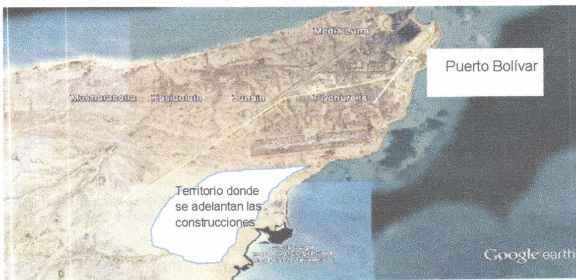
Figura. Ilustración del sitio donde se adelanta la construcción de las viviendas por parte de la empresa VANFER & CIA

En el recorrido se llegó al lugar donde se construye la vivienda a entregar a la señora ANICIA PUSHAINA, la cual se ubica aproximadamente en las coordenadas (X 1228814 – Y 1844087). La siguiente figura ilustra el sitio donde se adelanta el proyecto completo de viviendas: