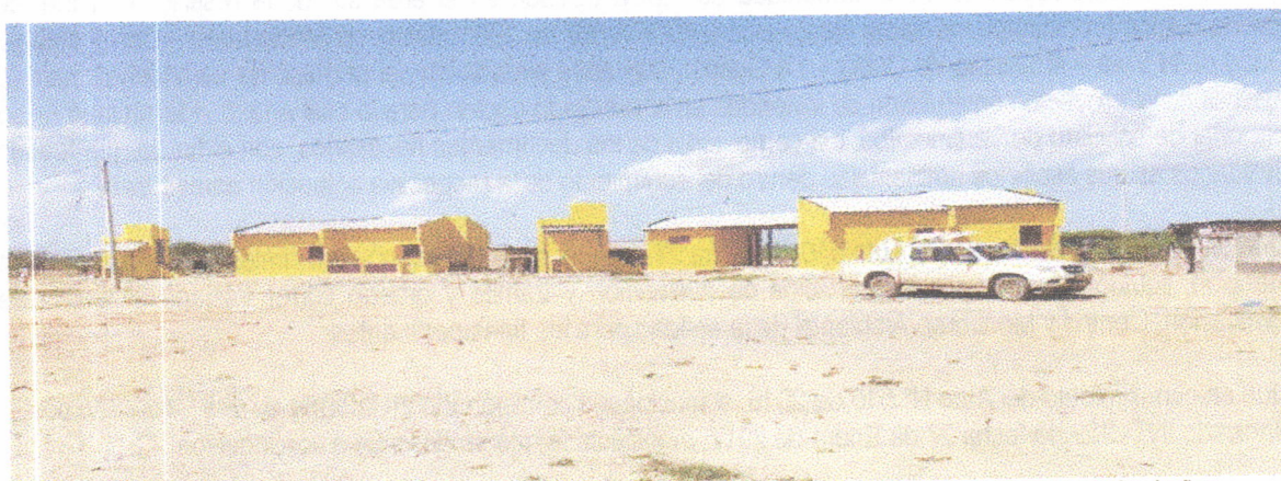
Fotografía 1. Panorámica de la fachada de las viviendas. A lado izquierdo de cada una se ubican los baños.

Las siguientes fotografías ilustran el modelo de las viviendas y el estado avance de las construcciones: