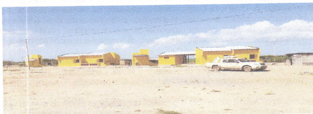
Fotografía 1. Panorámica de la fachada de las viviendas. A lado izquierdo de cada una se ubican los baños.

Las siguientes fotografías ilustran el modelo de las viviendas y el estado avance de las construcciones: