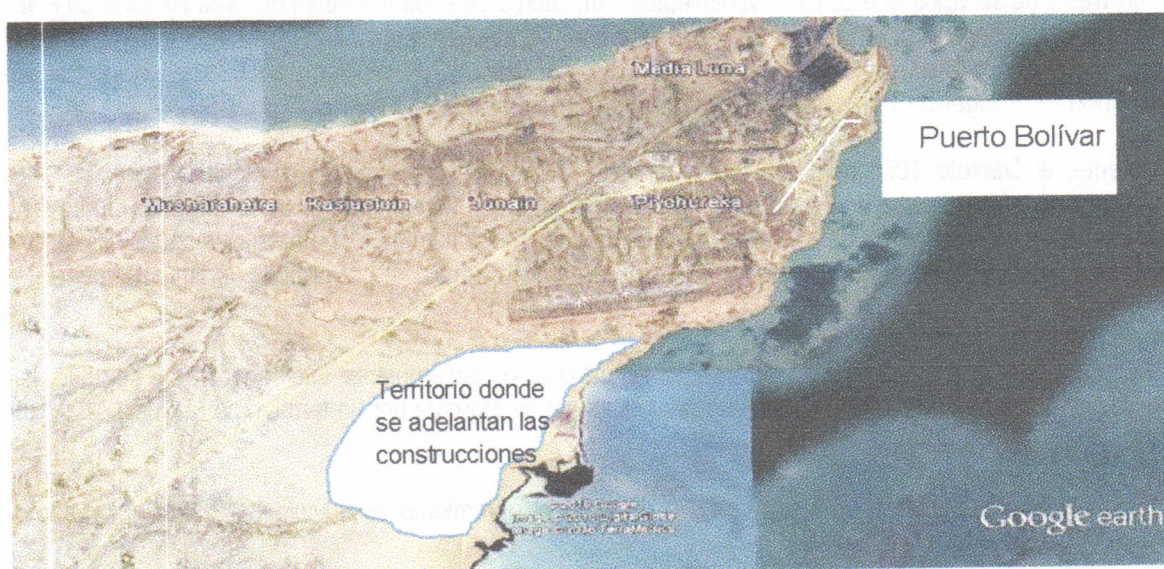
Figura. Ilustración del sitio donde se adelanta la construcción de las viviendas por parte de la empresa VANFER & CIA

En el recorrido se llegó al lugar donde se construye la vivienda a entregar a la señora REBECA EPIEYU, la cual se ubica aproximadamente en las coordenadas (X 1227343 – Y 1847735). La siguiente figura ilustra el sitio donde se adelanta el proyecto completo de viviendas: