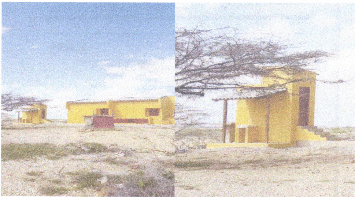
Fotografía 2. Diseño de la parte posterior de las viviendas. Fotografía 3. Vista final de lavadero y baño de la vivienda.

Igualmente se pudo observar que el terreno donde se adelantan los trabajos, es rocoso arcilloso con aporte de material calcáreos, producto de su cercanía a la franja marítima. La vegetación es monte espinoso y matorral semidesértico, propia de esta zona del país.