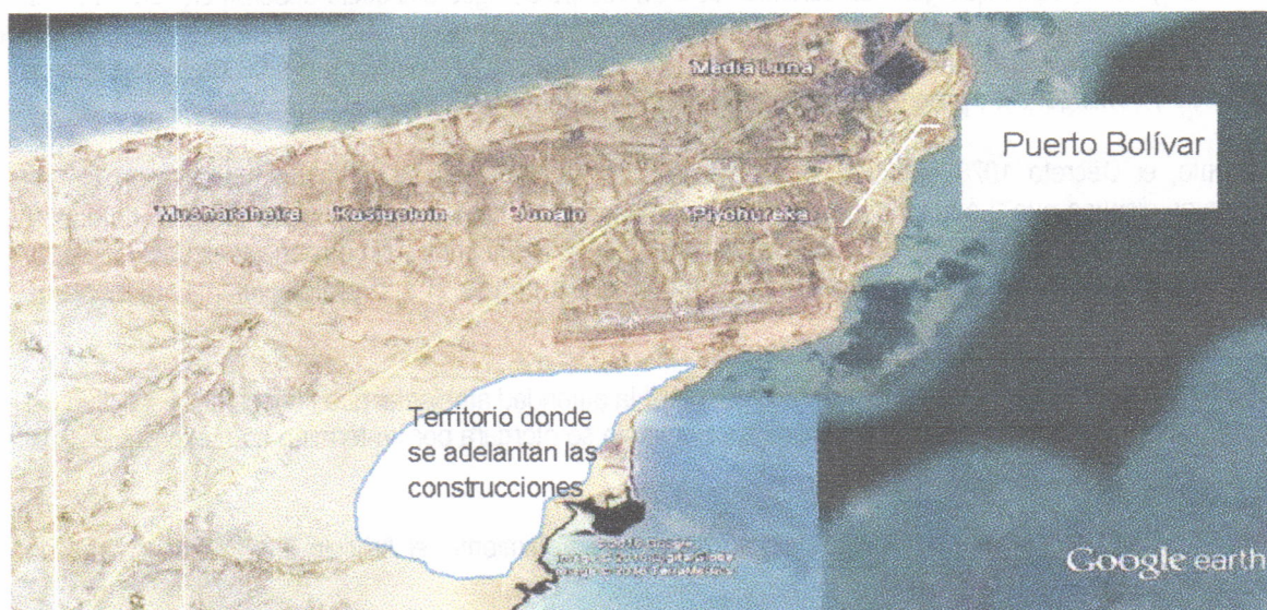
Figura. Ilustración del sitio donde se adelanta la construcción de las viviendas por parte de la empresa VANFER & CIA

En el recorrido se llegó al lugar donde se construye la vivienda a entregar a la señora JOSE MANUEL EPIAYU, la cual se ubica aproximadamente en las coordenadas (X 1228613- Y 1843955). La siguiente figura ilustra el sitio donde se adelanta el proyecto completo de viviendas: