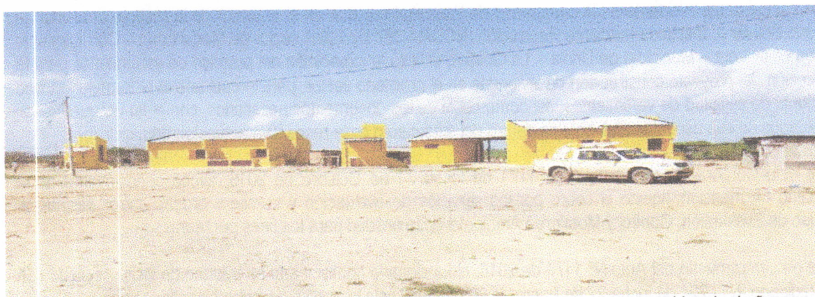
Fotografía 1. Panorámica de la fachada de las viviendas. A lado izquierdo de cada una se ubican los baños.

Las siguientes fotografías ilustran el modelo de las viviendas y el estado avance de las construcciones: