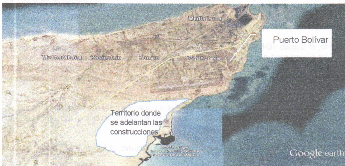
Figura. Ilustración del sitio donde se adelanta la construcción de las viviendas por parte de la empresa VANFER & CIA

En el recorrido se llegó al lugar donde se construye la vivienda a entregar a la señora MAGDALENA EPINAYU, la cual se ubica aproximadamente en las coordenadas (X 1227049 – Y 1843721). La siguiente figura ilustra el sitio donde se adelanta el proyecto completo de viviendas: