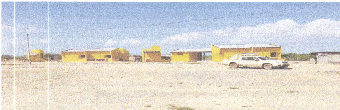
Fotografía 1. Panorámica de la fachada de las viviendas. A lado izquierdo de cada una se ubican los baños.

Las siguientes fotografías ilustran el modelo de las viviendas y el estado avance de las construcciones: