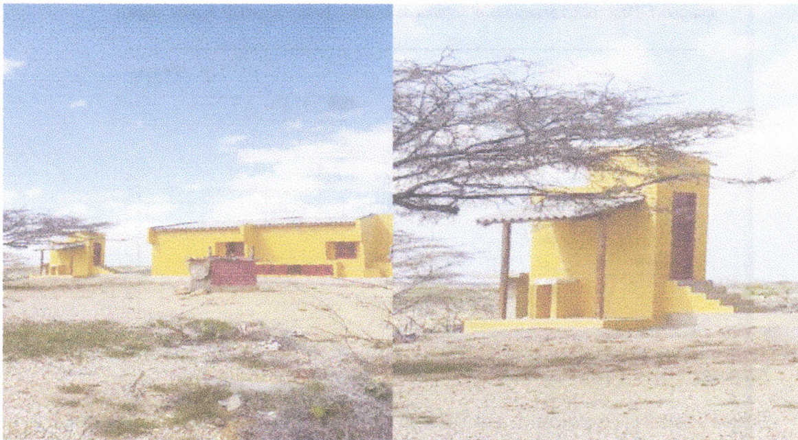
Fotografía 2. Diseño de la parte posterior de las viviendas. Fotografía 3. Vista final de lavadero y baño de la vivienda.

Igualmente se pudo observar que el terreno donde se adelantan los trabajos, es rocoso arcilloso con aporte de material calcáreos, producto de su cercanía a la franja marítima. La vegetación es monte espinoso y matorral semidesértico, propia de esta zona del país.