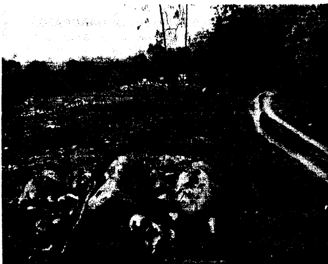
Zocola de dos (2) hectárea cercanas al rio ranchería