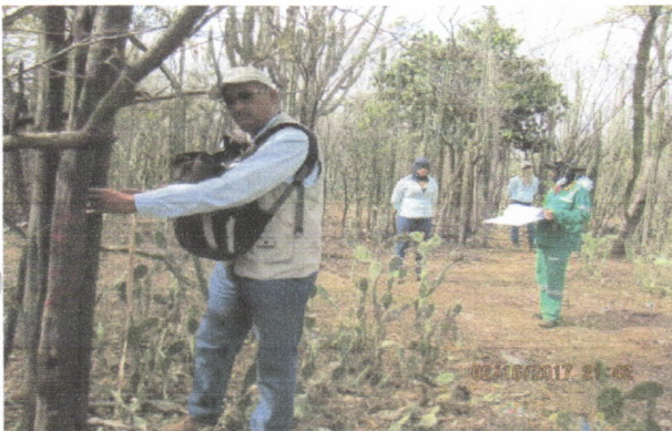
Área de cobertura más densa (Rastrojo Alto)

En el área a intervenir (2.2 hectáreas) para la construcción de las dos celdas en el relleno sanitario regional en el municipio de Fonseca la Guajira, se observó que predomina la presencia alta de Latizales y muy baja en Brinzales, estados de perfiles de vegetación secundaria por debajo de los Fustales, denominados vulgarmente con los nombres de sotobosque, debido a que el área todavía se conserva con cobertura vegetal natural y con intervención natural por efectos del pastoreo extensivo y entresaque selectivo de las especies maderables valiosas en el área, una erosión eleoca e hídrica bastante marcada y las características edáficas hacen que el sotobosque sea muy escaso en el área de estudio.