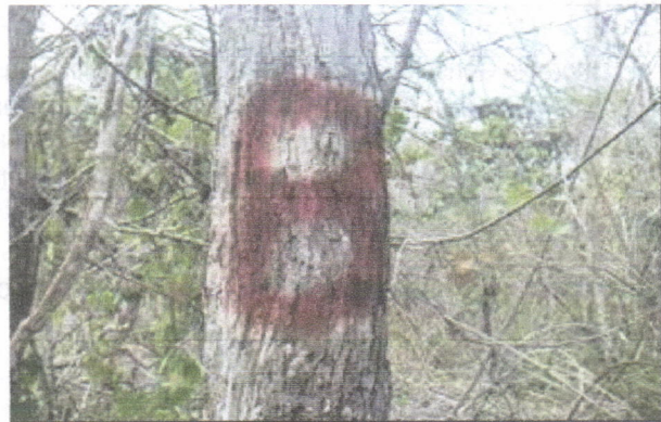
Especie Puy muestreada en el área