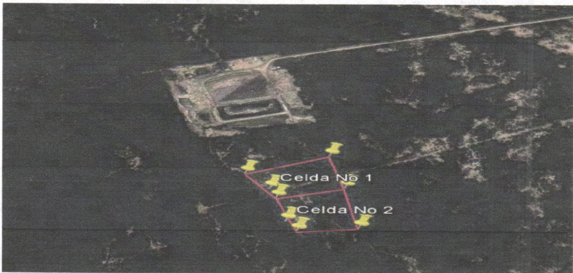
Coordenadas del área a Intervenir