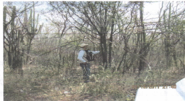
Área de cobertura intervenida (Rastrobajo)