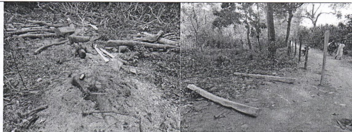
Evidencias de la tala del árbol de Morito y utilización de los productos obtenidos (Puntales)