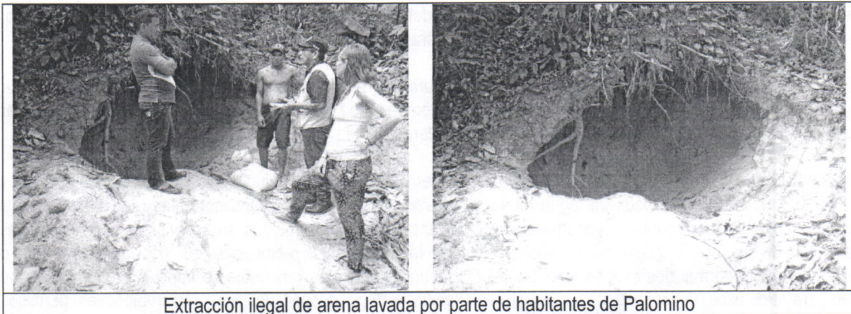
Extracción ilegal de arena lavada por parte de habitantes de Palomino