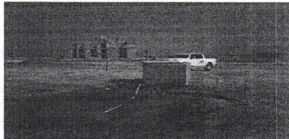
Fotografía 2. Ubicación del pozo