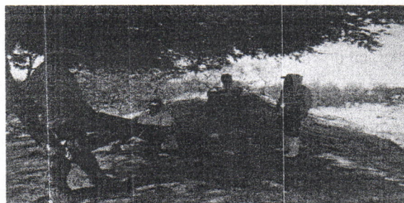
Fotografía 3. Socialización con el celador de la obra