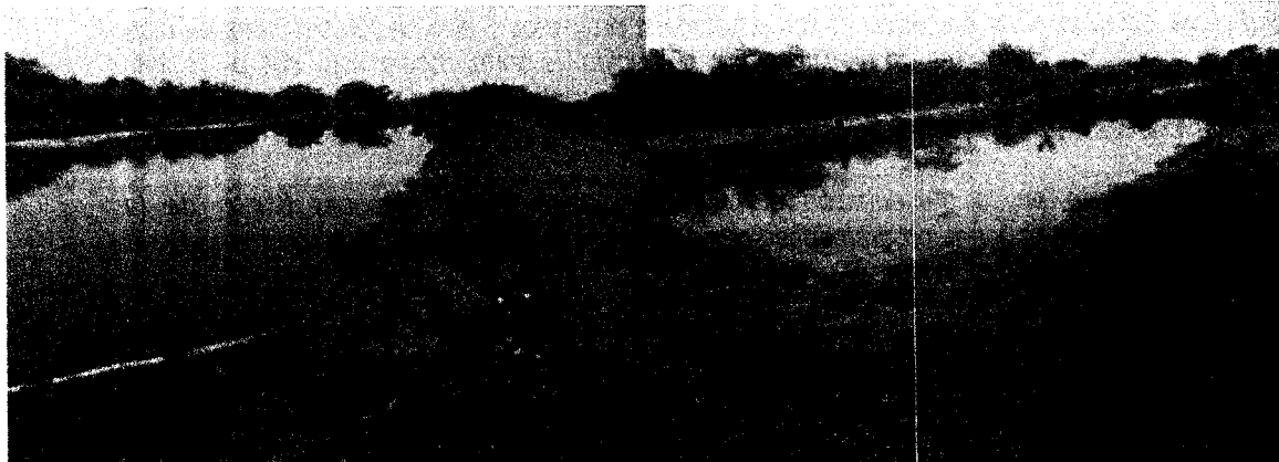
Fotografías No 1 y 2. Sistema de tratamiento de aguas residuales por medio de lagunas de oxidación sin geotextil o barreras que impidan la infiltración de dichas aguas al subsuelo y por ende contaminación de cuerpos de agua subterráneas. Sistema de tratamiento de aguas residuales de La Jagua del Pilar. 05/12/2016.