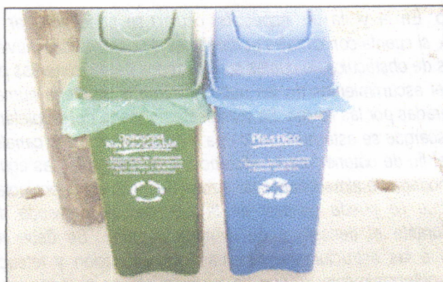
Foto No 4: Adquisición de recipientes para acopiar los residuos sólidos

de almacenamiento y que por eso la persona que efectuó la visita nunca los vio y tampoco preguntó por ellos.