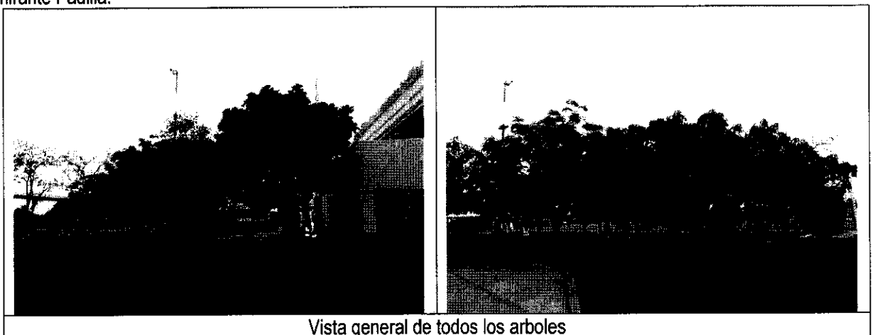
Tabla 3. Evidencias de los diez (10) especímenes que requieren ser podados en área interna del Aeropuerto Almirante Padilla.

Durante la visita de evaluación se observó que los árboles de las especies Roble y Almendro, se encuentran paralelos a los accesos peatonales, en las áreas internas de zonas verdes se ubican los árboles de mango y Acacia amarilla, la poda es para despejar la obstaculización de la visibilidad desde la torre de control, estos árboles no presentan desarrollos incontrolables dado que en otras ocasiones les han realizados podas de manejo.