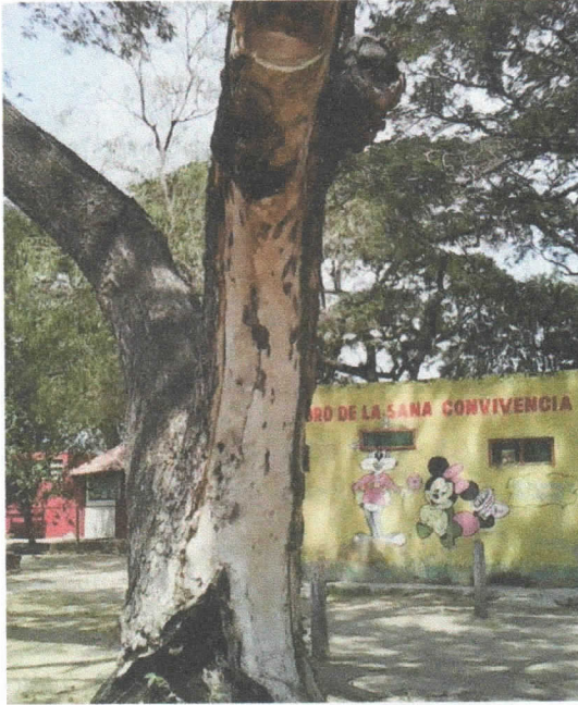
Árbol 1, con parte de su fuste seco, por quema de basura en esta parte.