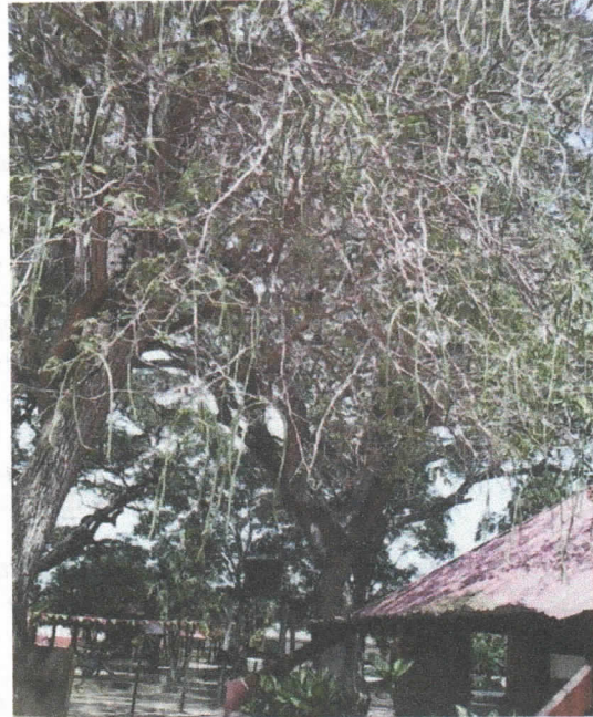
Árbol 2, con parte de sus ramas sobre el techo de un salón del