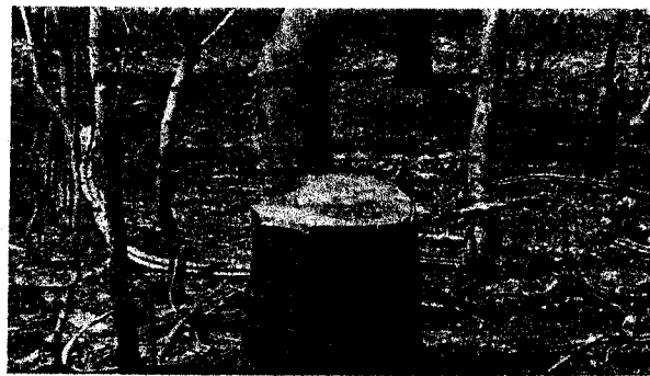
Evidencias de árboles cortados el área