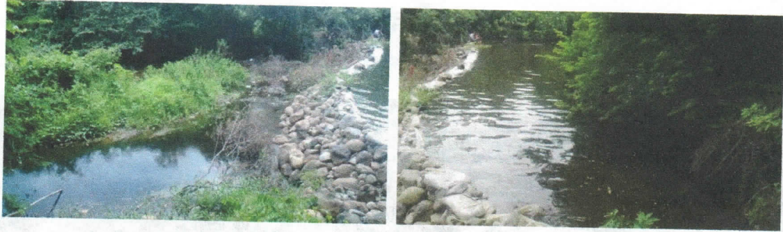
RIO RANCHERIA AGUAS ABAJO Y AGUAS ARRIBA DEL EMPEDRADO