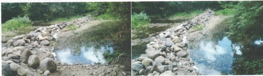
MURO EN PIEDRAS SOBRE CAUCE DEL RIO RANCHERIA