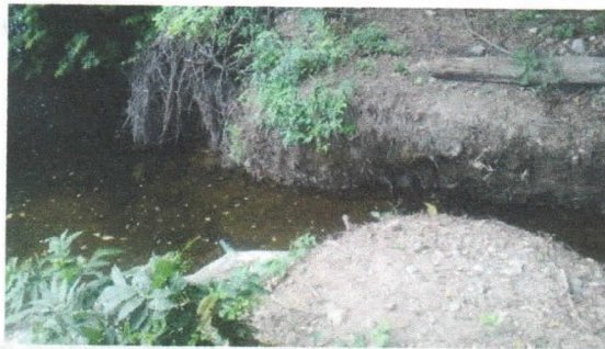
DERIVACION SOBRE RIO RANCHERIA DE CANAL ARTIFICIAL AL PREDIO "LA VEGA"