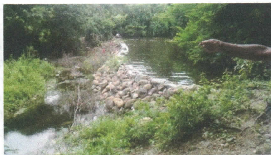
MURO EN PIEDRAS SOBRE CAUCE DEL RIO RANCHERIA