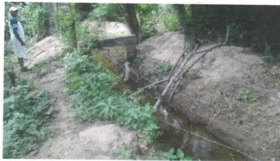
CANAL ARTIFICIAL QUE CONDUCE EL AGUA DESDE EL RIO RANCHERIA AL PREDIO "LA VEGA"