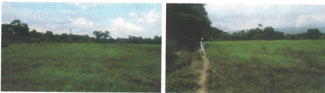
CULTIVO DE ARROZ PREDIO "LA VEGA"