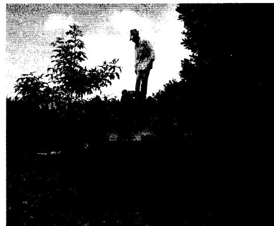
Producto descargado en el predio Río claro