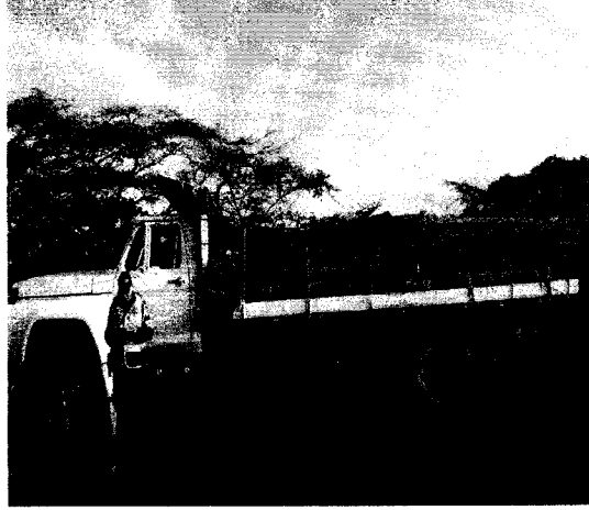
Vehículo con el producto en el sitio de la incautación km 62 vía Maicao