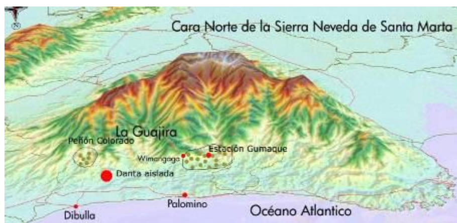
Mapa ProSierra Ubicación de la Danta Aislada.