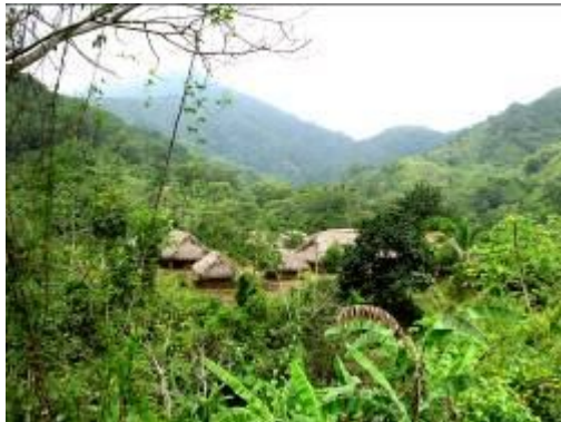
Pueblo indígena Wiwa Gomaque