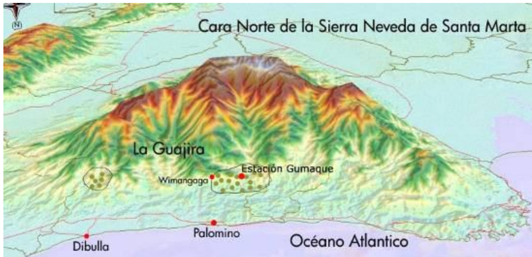
Mapa, Fundación ProSierra. Localización de la Estación Científica Gumaque

Esta construcción permite desde ahora, tener un espacio para alojar a las personas que hacen parte del proyecto Danta en Gumaque, en la cuenca del río Palomino.