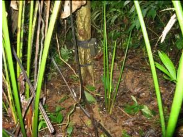
Primeras Cámaras Fotográficas Trampa instaladas en Sabanaculebra.

Este proceso ha permitido la participación de mas miembros de la comunidad indígena en el funcionamiento de esta metodología de las cámaras fotográficas trampa, como se ve a continuación.