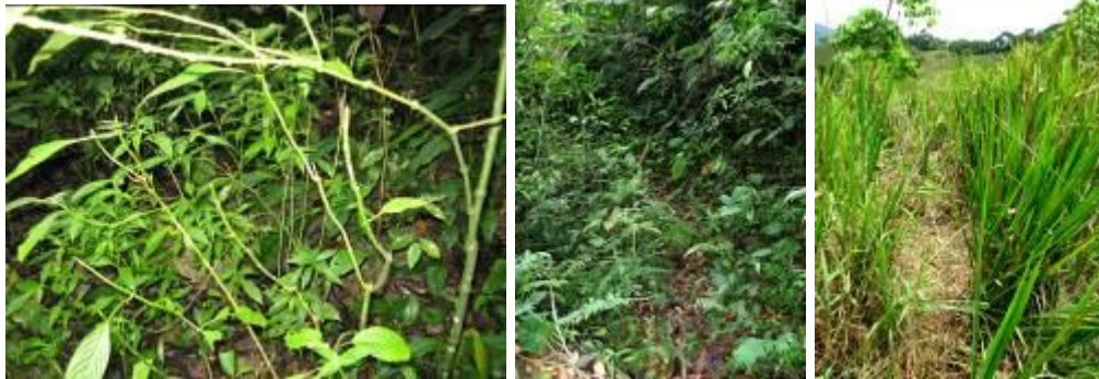
Trillo y caminos de Danta