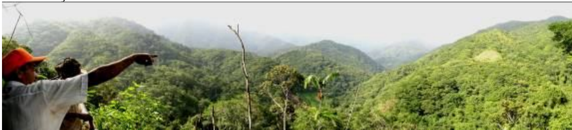
Panorámica de la región Peñón Colorado.