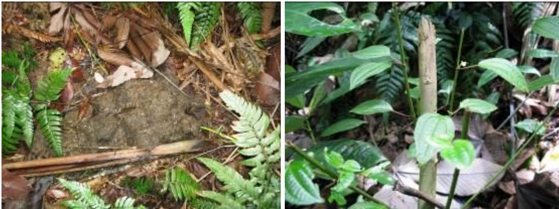
Rastros de las Dantas.