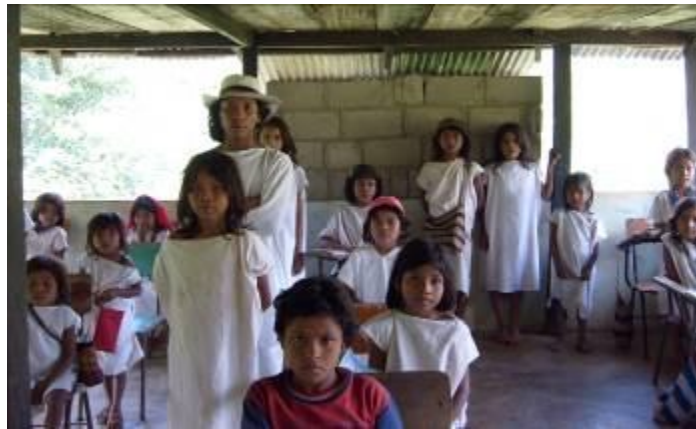
Escuela Wiwa de Gomaque.