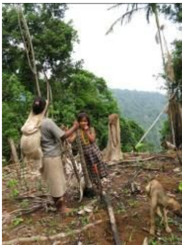
A 950 msnm en Peñón Colorado