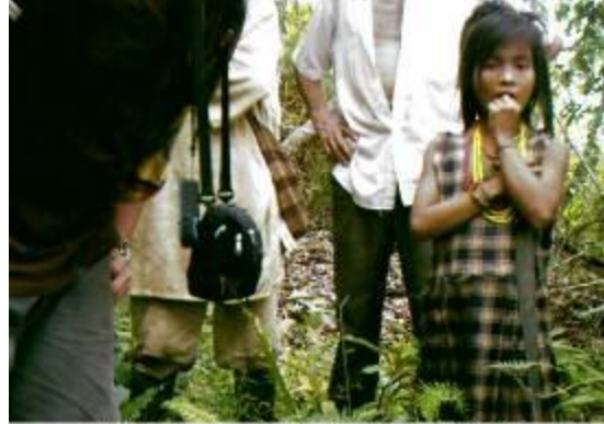
Fotos de CFT al momento de ser instaladas en campo.

En esta localidad es necesario nombrar aspectos importantes e interesantes en el desarrollo de esta estrategia de conservación en la región del río Jerez.