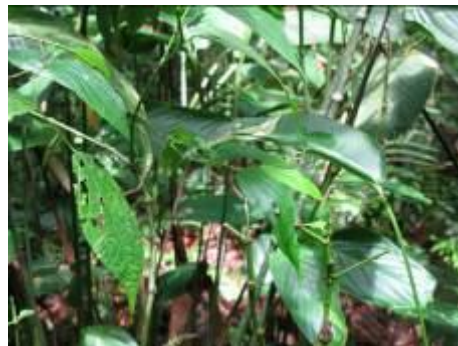
Trillo de Danta