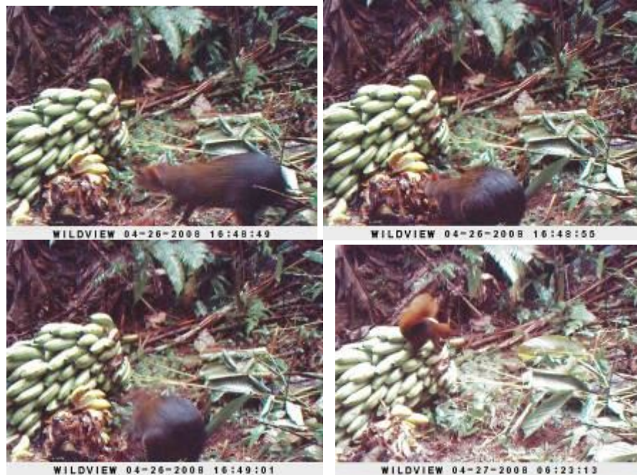
Primeras fotografías de las cámaras trampa en Sabanaculebra.

Posteriormente, se planificaron las salidas a campo, en recorridos desde 4 a 6 horas diarias, a cada una de las regiones con presunta presencia actual de la Danta en la región.