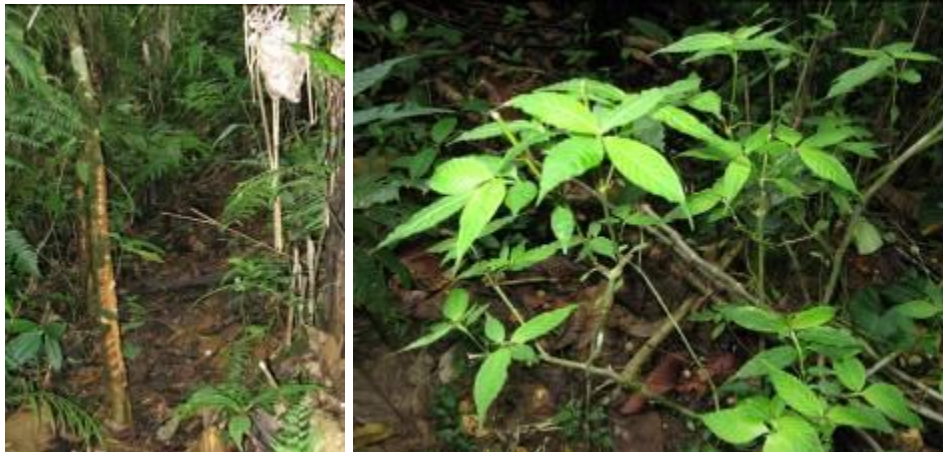
Rastros de la Dantas.