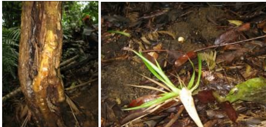
Rastros de las Dantas.

Teniendo como base los rastros de las Dantas, se procedió a la instalación de las primeras CFT, en la región de Sabanaculebra.