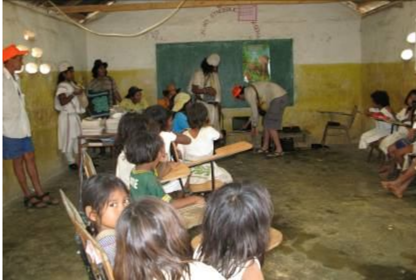
Escuela de Gumaque o Sabanaculebra.