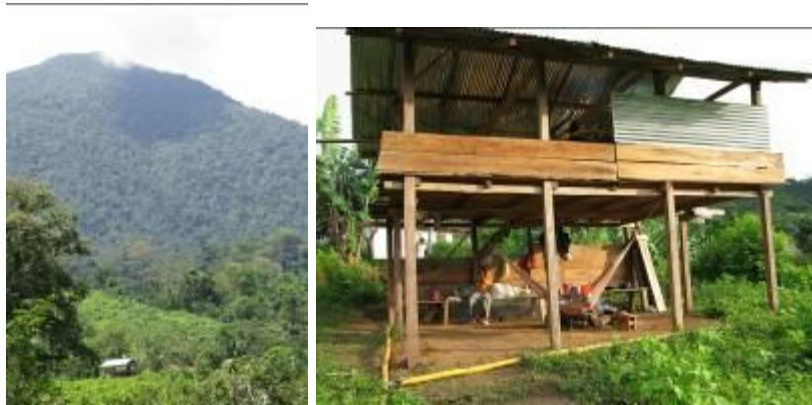
Estación Científica Gumaque 2008.

de la comunidad, se señaló el lugar permitido para hacer la construcción de la Estación Científica Gumaque en Sabanaculebra.