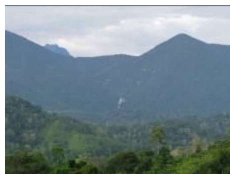
Panorámica de la región con Dantas en Sabanaculebra.

En estas salidas a campo, se pudieron obtener los siguientes rastros que comprobaron la presencia de estos animales, para posteriormente hacer las instalaciones de las CFT.