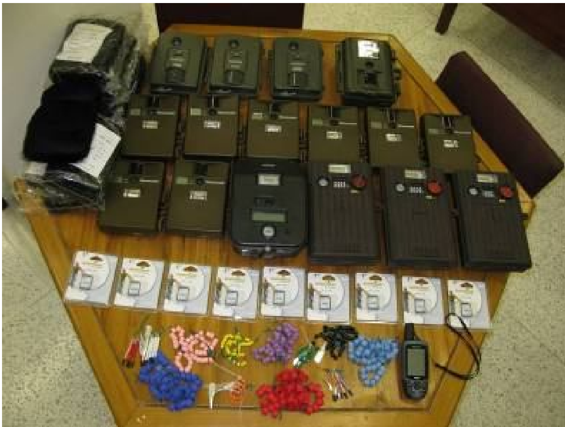
Equipo de monitoreo de fauna silvestre CORPOGUAJIRA 2008

Una vez los equipos en La Guajira, se procedió a presentarlos en las oficinas de CORPOGUAJIRA para levantar un acta de entrega de dichos equipos por parte de la corporación, al proyecto Danta.