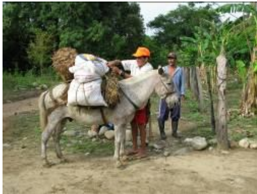
Cayo y Jarava, salida a la región del Jeréz