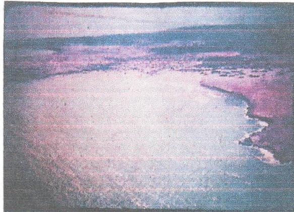
Foto. 1: El área de la Playa Ipari antes de la existencia de Puerto Bolívar (1982)

En relación con lo anterior, es importante precisar a la Corporación, como se ha hecho en anteriores comunicaciones, que la llamada Laguna Ipari se creó a partir de la utilización de arenas que se encontraban en el área de la playa con este mismo nombre y al generar una depresión en el terreno, unido al punto de descarga del agua de salmuera se creó la zona denominada actualmente como laguna Ipari, es decir que el mismo no es un sistema natural, como lo muestran las fotografías históricas que se muestran a continuación (ver fotografías 1 y 2).