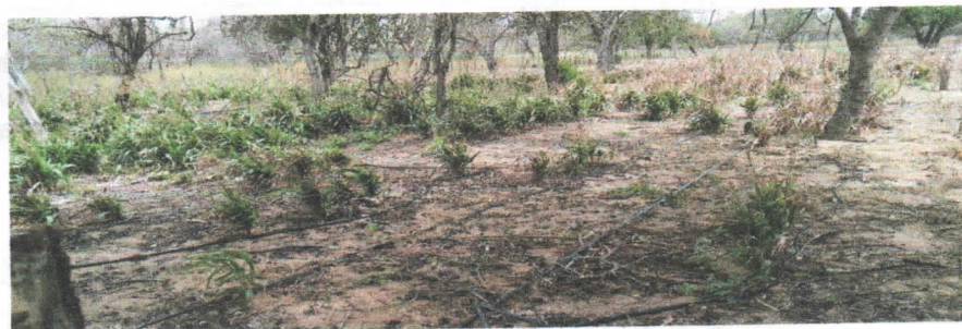
Fotografía 5Cultivo de maíz y sorgo

Actualmente no se cuenta con un sistema que permita la medición de los caudales captados y los volúmenes empleados en cada uno de los usos descritos anteriormente. Según lo manifestado por la comunidad indígena el agua que se extrae del pozo es salobre.