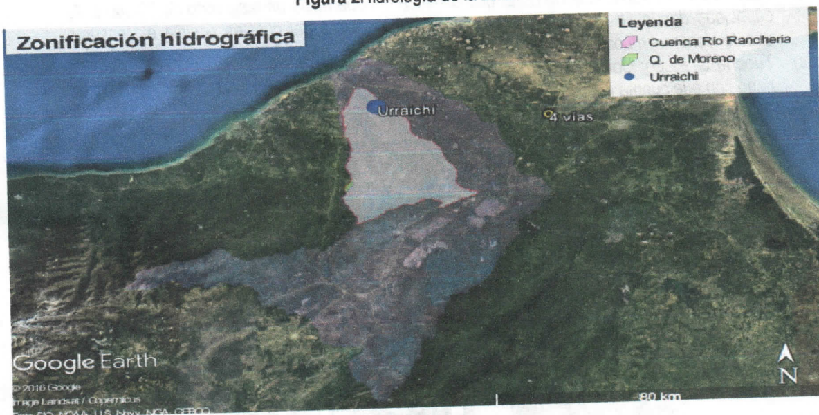
Figura 2 Hidrología de la zona

El punto de captación se localiza sobre la cuenca del río Ranchería, en la subcuenca quebrada Moreno (ver Figura 2) En el predio de interés no se localizó ningún drenaje superficial lótico de tipo permanente o intermitente. Con respecto a los cuerpos lénticos, no se localizaron jagüeyes.