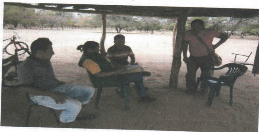
Fotografía 7Seguimiento social