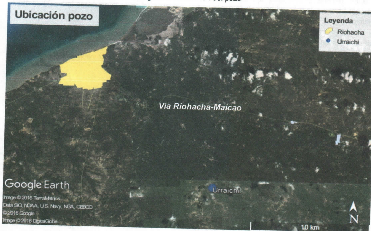
Figura 1 Localización del pozo

La comunidad indígena de Urraichi se encuentra en zona rural del distrito de Riohacha, a una distancia de 12 km del casco urbano sobre la vía que del distrito conduce hacia Maicao, punto a partir del cual se deben recorrer aproximadamente 7.3 km en dirección sur para llegar a la comunidad.