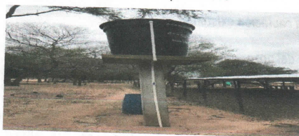
Fotografía 3 Tanque elevado