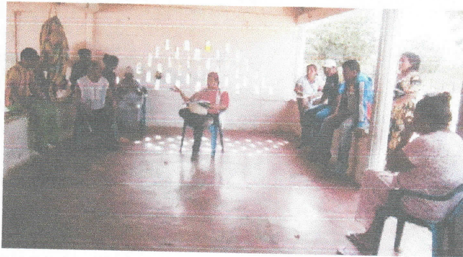
Fotografía 6Acompañamiento social