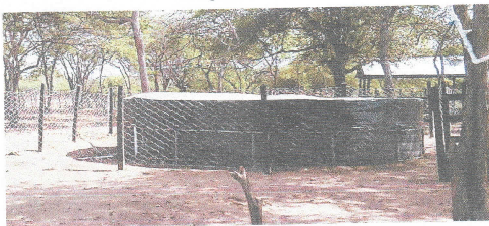
Fotografía 4 Reservoirio