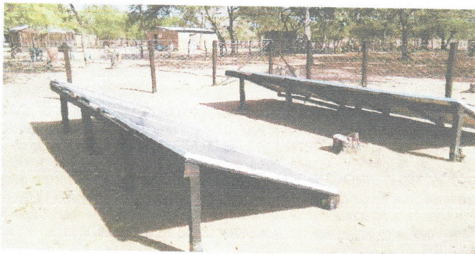
Fotografía 1 Predio visitado

Valorando lo anterior, se procedió a realizar un recorrido con el fin de identificar las características de la zona donde se localiza el pozo: cuerpos de agua cercanos, presencia de otros aprovechamientos de agua subterránea, fuentes potenciales de contaminación, usos del suelo y usos del agua. Adicionalmente, se elaboró un diagnóstico social de la comunidad Cochorretamana, con el fin de recopilar información respecto al funcionamiento del sistema, usos del agua, comunidades beneficiadas, operación del proyecto y demás relacionadas.