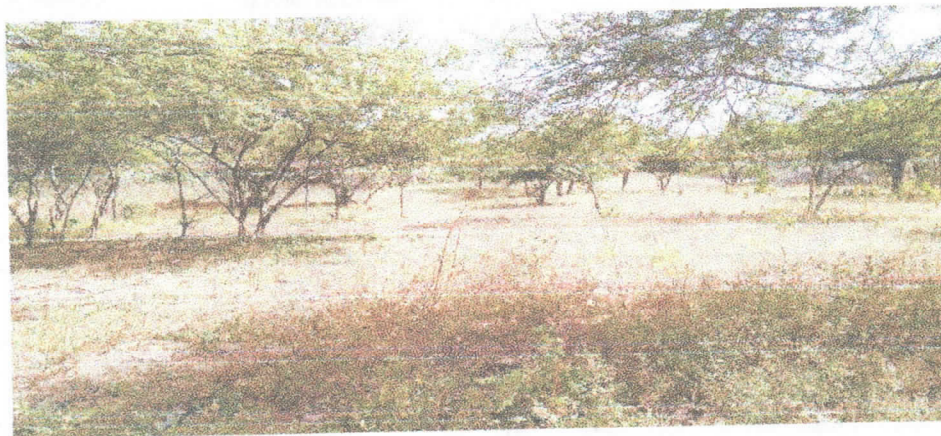
Fotografía 5 Zona de cultivo

Actualmente no se cuenta con un sistema que permita la medición de los caudales captados y los volúmenes empleados en cada uno de los usos descritos anteriormente. Según lo manifestado por la comunidad indígena el agua que se extrae del pozo es salobre.