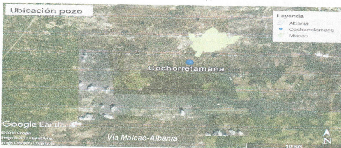
Figura 1 Localización del pozo

La comunidad indígena Cochorretamana se encuentra en zona rural del municipio de Maicao, a una distancia 1 km del casco urbano.