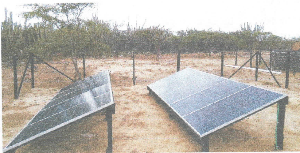
Fotografía 1 Predio visitado

otros aprovechamientos de agua subterránea, fuentes potenciales de contaminación, usos del suelo y usos del agua. Adicionalmente se elaboró un diagnóstico social de la comunidad de La Piedra, con el fin recopilar información respecto al funcionamiento del sistema, usos del agua, comunidades beneficiadas, operación del proyecto y demás relacionadas.