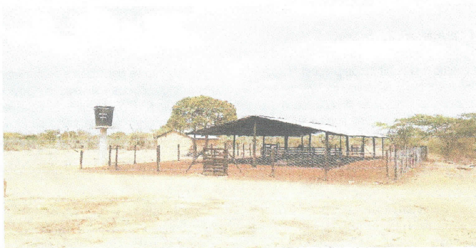
Fotografía 3 Consumo del aprisco y tanque elevado