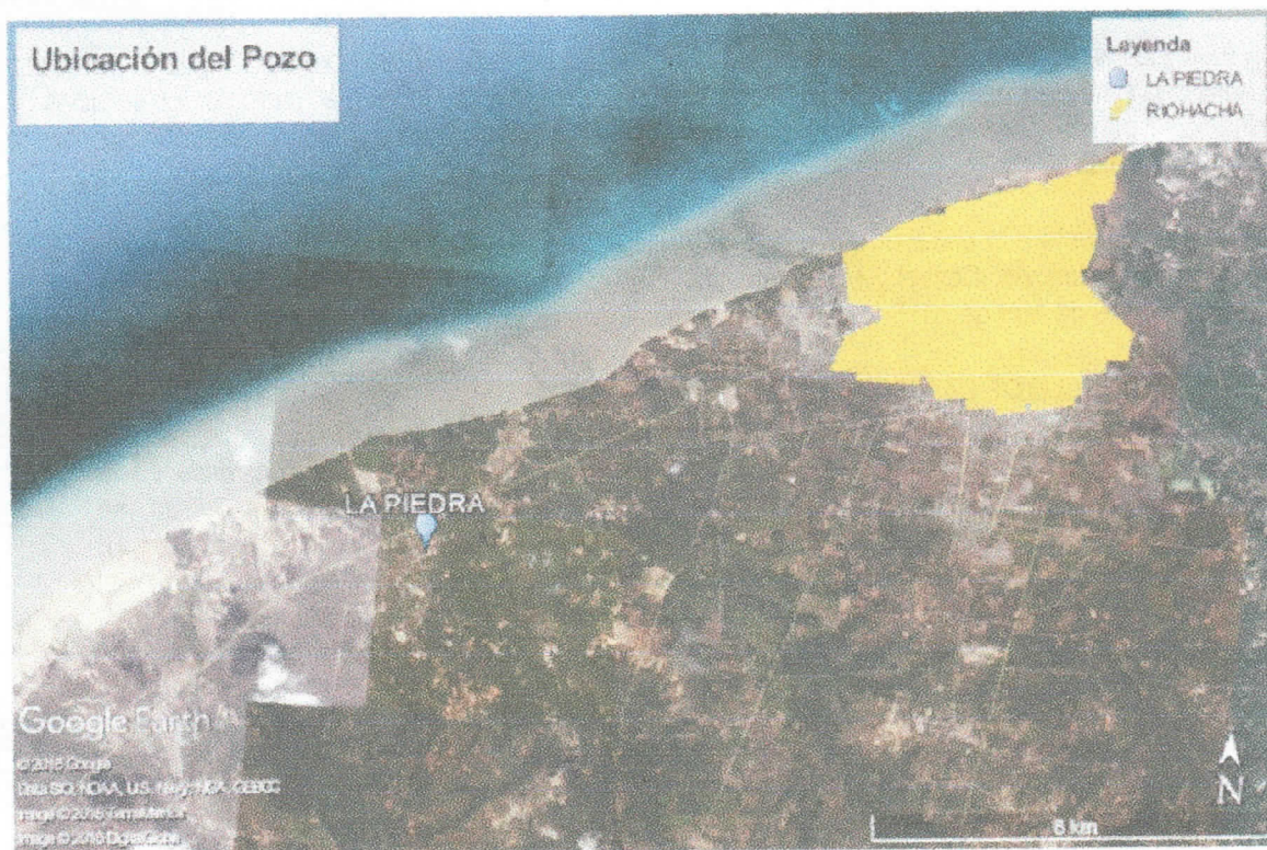
Figura 1 Localización del pozo

La comunidad indígena La Piedra se encuentra en zona rural del distrito de Riohacha, en el kilómetro 4 sobre la vía que comunica al distrito con el corregimiento de Camarones, punto a partir del cual se recorren 500 m en dirección sur para llegar a la comunidad.