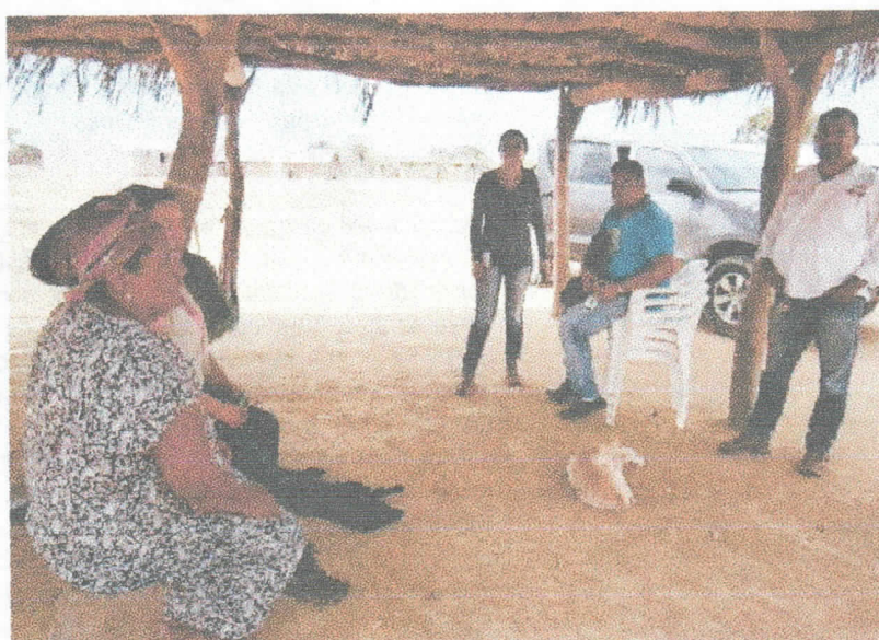
Fotografía 6 Acompañamiento social