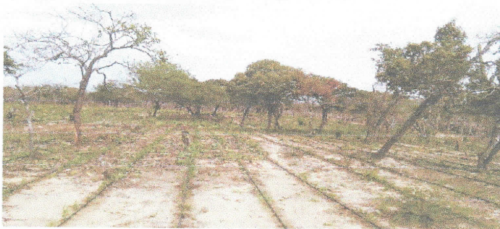
Fotografía 5Cultivo de maíz y sorgo

Actualmente no se cuenta con un sistema que permita la medición de los caudales captados y los volúmenes empleados en cada uno de los usos descritos anteriormente. Según lo manifestado por la comunidad indígena el agua que se extrae del pozo es altamente salobre, por lo cual el agua de consumo humano directo (bebida y preparación de alimentos) es extraída de un jagüey.