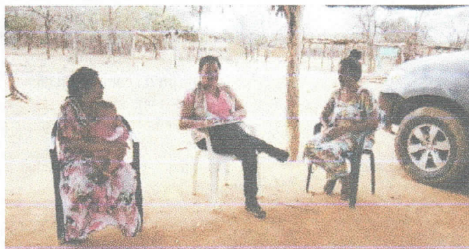
Fotografía 7 Acompañamiento social