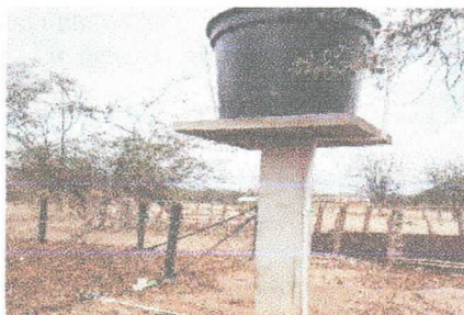
Fotografía 3 Consumo del aprisco y tanque elevado.