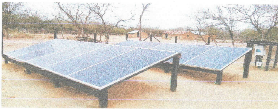
Fotografía 1 Predio visitado

otros aprovechamientos de agua subterránea, fuentes potenciales de contaminación, usos del suelo y usos del agua. Adicionalmente, se elaboró un diagnóstico social de la comunidad de Jayapamana, con el fin recopilar información respecto al funcionamiento del sistema, usos del agua, comunidades beneficiadas, operación del proyecto y demás relacionadas.