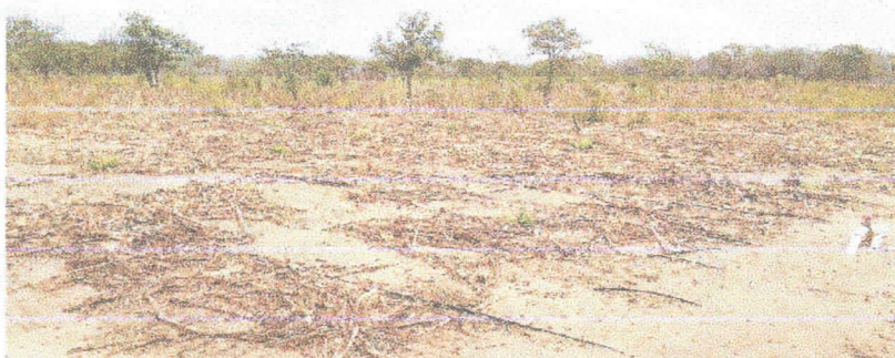
Fotografía 5 Zona de cultivo

Actualmente no se cuenta con un sistema que permita la medición de los caudales captados y los volúmenes empleados en cada uno de los usos descritos anteriormente. Según lo manifestado por la comunidad indígena el agua que se extrae del pozo es salobre.