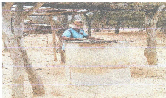
Fotografía 6 Pozo artesanal

Como se mencionó anteriormente, dentro del predio se localizó un jagüey; sin embargo, no se está haciendo uso de este. Por otro lado, se identificó un pozo artesanal de 35m de profundidad, del cual se abastecían anteriormente, localizado en las coordenadas: 11°27'51.53"N-72°53'23.10"O (ver Fotografía 6).