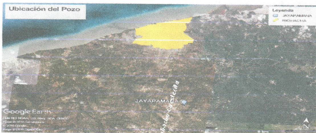
Figura 1 Localización del pozo

La comunidad indígena de Jayapamana se encuentra en zona rural del distrito de Riohacha, a 4 km de distancia sobre la vía que comunica al distrito con Cuestecita; punto a partir del cual se recorren 2 kilómetros en dirección este para llegar a la comunidad.