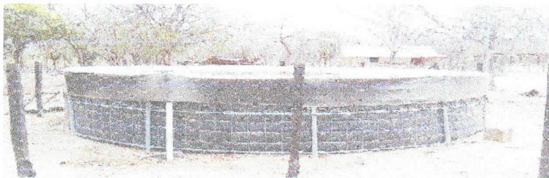
Fotografía 4 Reservorio