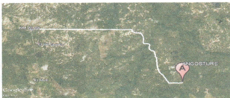
Figura No.1 Localización de la perforación en el Predio

izquierda en el kilómetro 21.88, a partir de allí se recorren 11.9 Kilometro hasta la llegada al sitio de interés (ver Figura 1), en las coordenadas mostradas en la Tabla No.1.