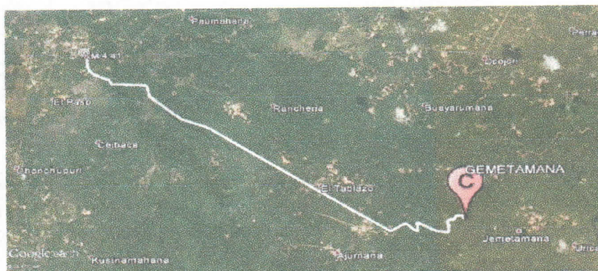
Figura No.1 Localización de la perforación en el Predio