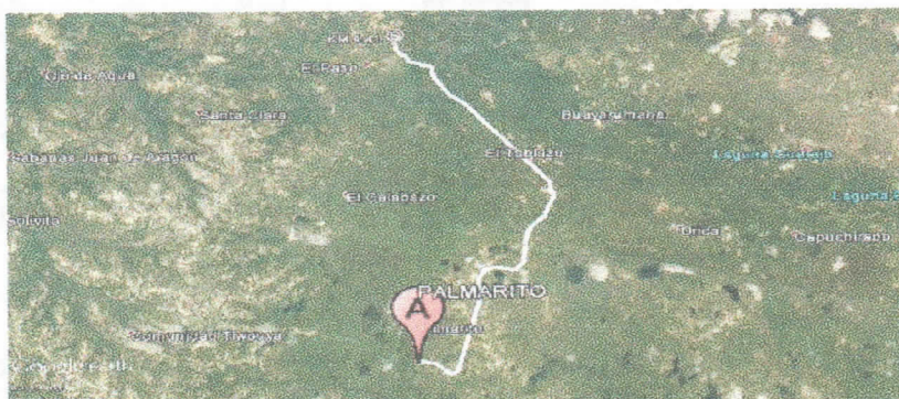
Figura No.1 Localización de la perforación en el Predio