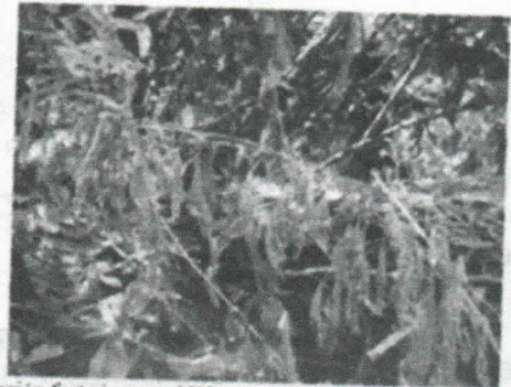
Ubicación fuste imagen N°3 no se aprecia por presencia de abejas