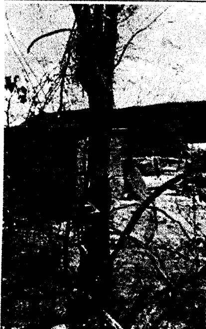
2 Espinito Colorado