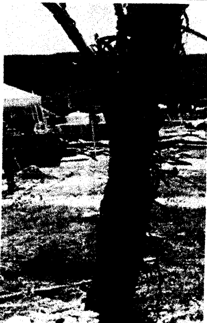
1 Espinito Colorado