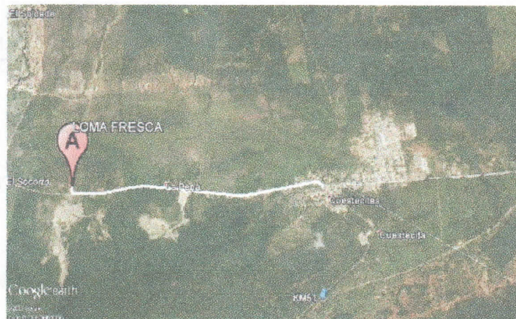
Figura No.1 Localización de la perforación en el Predio

partir de allí se recorren 0.8 Kilometro hasta la llegada al sitio de interés (ver Figura 1), en las coordenadas mostradas en la Tabla No.1.