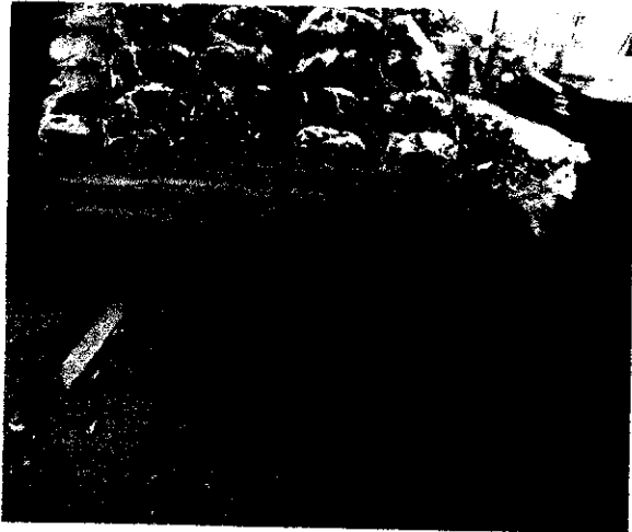
Productos florísticos dejados a disposición de CORPOGUAJIRA