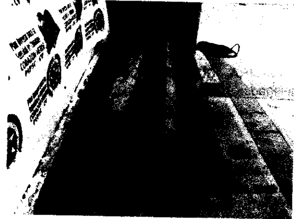
Productos decomisados acopiados en la estación de policía de Villanueva