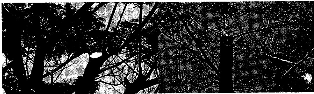
Especie algarrobbillo ( Samanea samán )

Evidencia de las podas que se vienen realizando en km PR24+300 al km PR 25+998 del tramo de vía Mingueo - Riohacha.