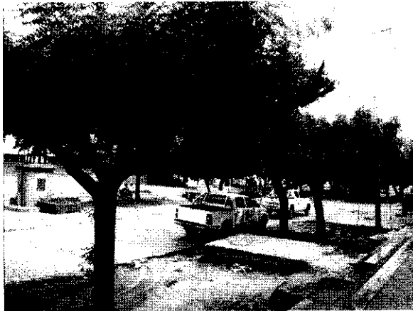
Arboles de Neem y área que desean adecuar paralela a la calle 10 para el parque de vehículos de usuarios