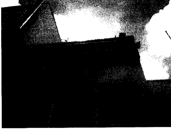
Arboles de Neem ubicados en área de la empresa paralelos a la carrera 11 los cuales no serán talados y evidencia de la identificación de la empresa de telecomunicaciones en el Municipio de Maicao.