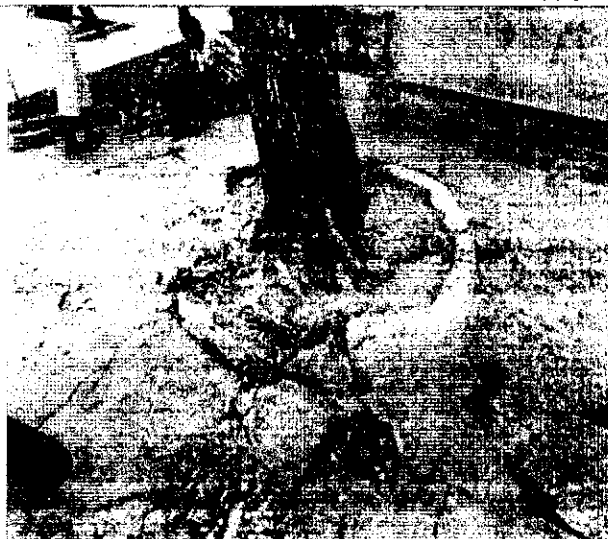
Deterioro del concreto originado por el sistema radical del árbol de almendro