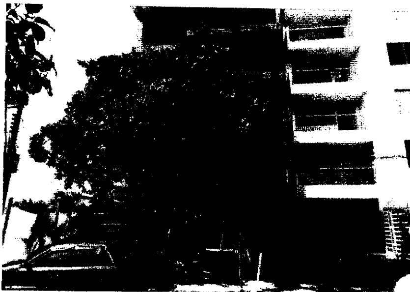
Ubicación del árbol frente al edificio