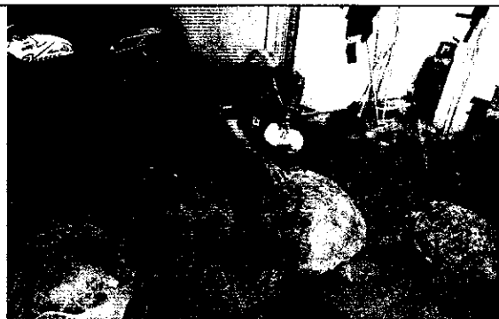
Identificación y valoración de los especímenes