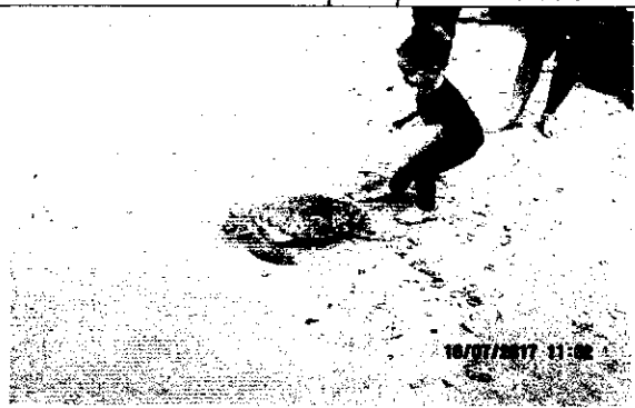
Otras evidencias de la liberación