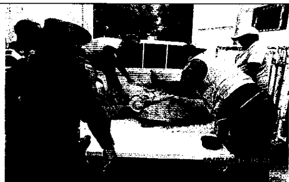
Procedimiento del transporte para la liberación