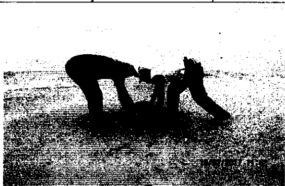
Liberación de los especímenes