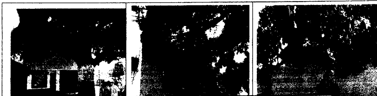
Ramificaciones haciendo contacto con el tejado de la vivienda y con las

Se efectuó el reconocimiento del individuo arbóreo, se realizó su respectiva medición del diámetro de altura conocido como DAP (Diámetro altura de pecho) y se sacó su altura máxima, obteniendo el siguiente volumen (m3):