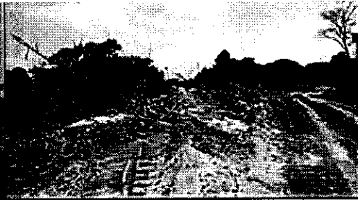
Dstrucción de cobertura por construcción de vía o acceso al predio de Félix Villamizar.