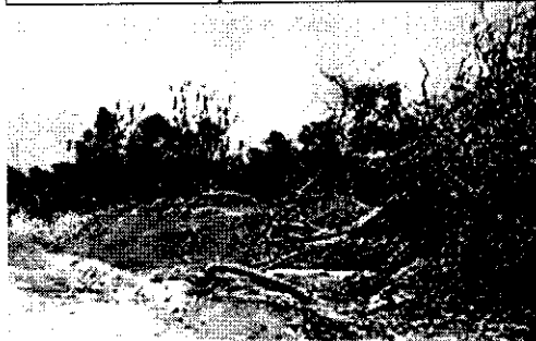
Mas evidencia de la destrucción de la cobertura vegetal de la franja protectora en el río Tapia