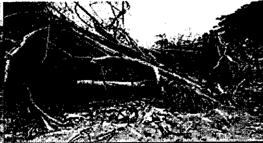
Dstrucción de cobertura en el predio de Aldo Mejía por acceso al predio de Félix Villamizar