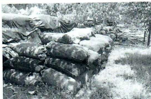
Decomiso de carbón vegetal acopiado en el predio Río claro