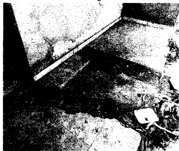
Evidencias de trabajos realizados en el inmueble