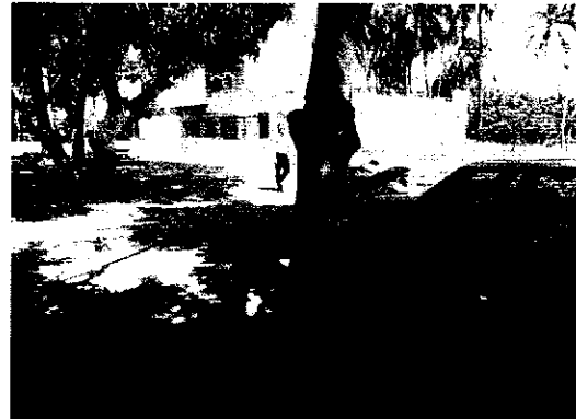
Árbol de mango más desarrollado