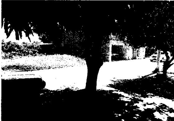
3.3 Evidencias de los árboles objeto de la solicitud Árbol de mango joven