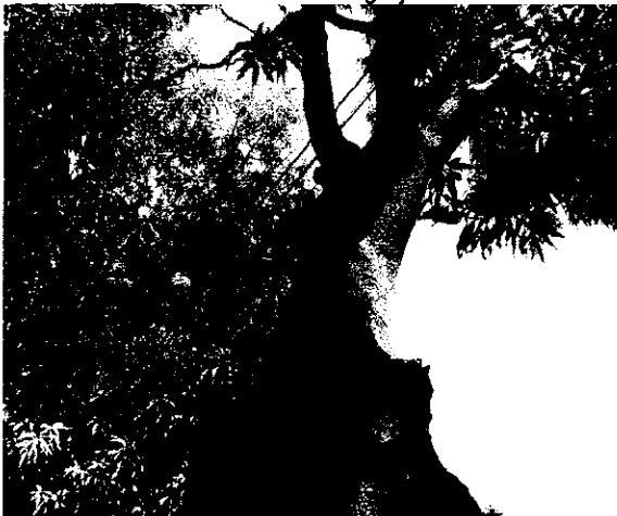
Líneas entrecruzadas con la copa del árbol