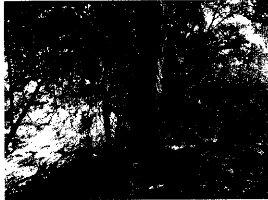
Foto izquierda, (árboles de Cedro y Melina, amenazados por el meandro que forma el río jerez en la parcela del señor Rubén Cotes Sprockel). Foto derecha, (árbol de cedro debilitado en el sistema radical por la corriente del río jerez)