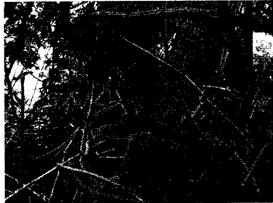
Evidencias del proceso de erosión y debilitamiento del sistema radical del árbol de cedro antes citado