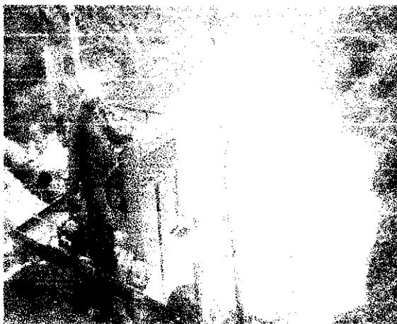
Imagen 3. Piscina de succión