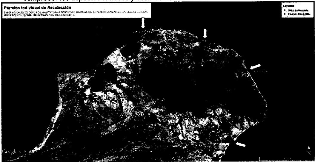
Imagen 1. Área solicitada