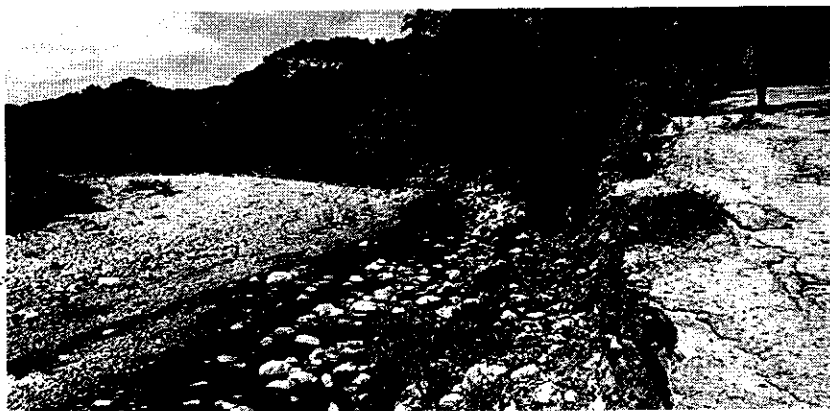
Fotografía 2: Vía Paso Cueva Honda afectada por socavación. 29 de agosto de 2017.

Igualmente, es de principal preocupación los procesos erosivos generados en el sitio conocido como Paso a Cueva Honda, en el cual ha afectado significativamente la vía que conduce de Cotoprix hacia esa región.