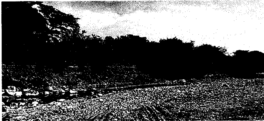
Fotografía 1: Margen erosionada. Río Cotoprix - Concesión minera 045-44 CI GRODCO S.C.A INGENIEROS CIVILES. 29 de ago. de 2017.

Durante el recorrido efectuado, es evidente la afectación sobre las márgenes del río, las cuales en algunos sitios se encuentra significativamente erosionada y con el riesgo de seguir presentando procesos de socavación que en eventuales crecientes ocasionarían pérdidas de terrenos en los predios ubicados en estas áreas.