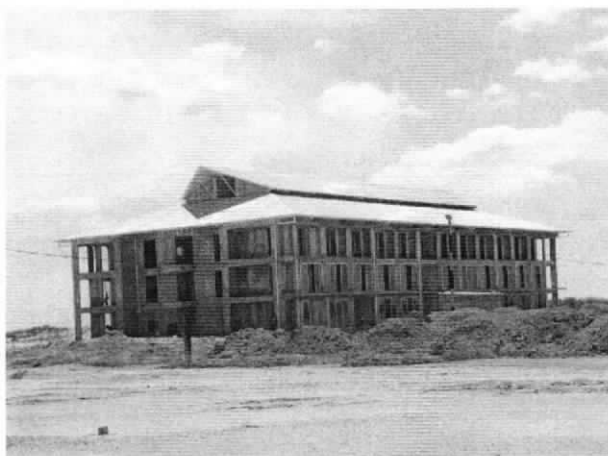
Foto 6. Hotel en Construcción

Frente a la construcción del hotel, en las coordenadas 72°51'4.19"O y 11°36'14.43"N (Datum Magna Sirgas), se encuentra el campamento de trabajadores y acopio de material para la construcción.