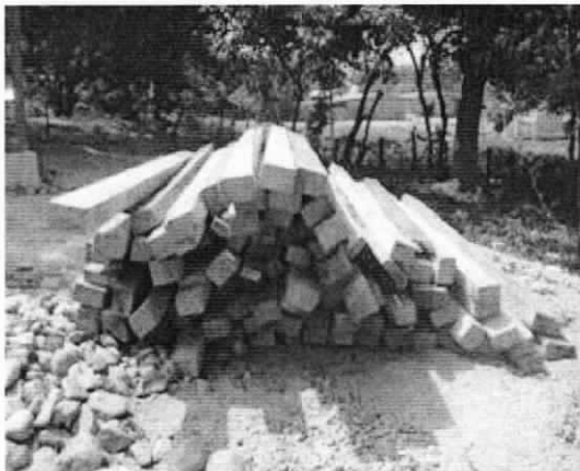
Producto acopiado en Palomino