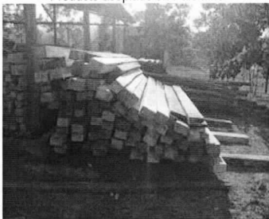
Producto en el CAV Rio Claro