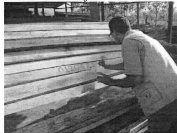
Marcaje del producto en el CAV Rio Claro