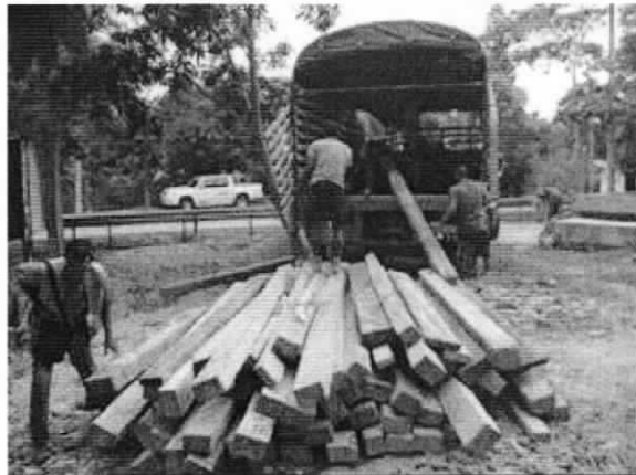
Recogiendo el decomiso