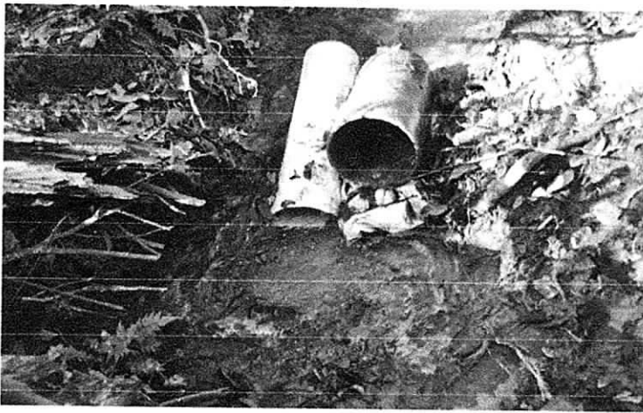
Terraza levantada con madera del árbol talado