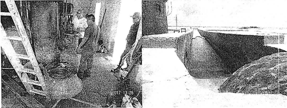
Fotos 1 y 2. Visita al sistema de Bombeo