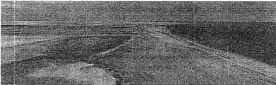
Foto 4. Panorámica del estado del manglar, se ve gran cantidad de manglar seco y lagunas sin agua

En lo que tiene que ver con el ecosistema del manglar que hace parte del Área Protegida, del DMI Musichi, la situación es bien preocupante, ya que se pudo apreciar en el recorrido efectuado que este presenta serios problemas de resequeidad tanto en su sistema radicular como en sus hojas y tallo debido a la falta de flujo de agua. Por el estado en que se encuentran las lagunas, pero principalmente la Neima, se presume que el ecosistema lleva varios meses sin recibir un flujo continuo de agua, los cuerpos de agua que conforman el sistema lagunar, se observan parcialmente secos, algunos cuentan con un espejo de agua muy bajo, disminuyendo las capacidades de éste para soportar las especies de flora y fauna que allí se desarrollan y en caso de pretender suministrar de ésta terminaría por matarlos por el alto contenido de sal que ofrecen estos espejos de agua.