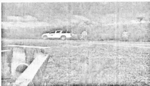
VIA SAN JUAN DEL CESAR – VALLEDUPAR (PR 67+420)