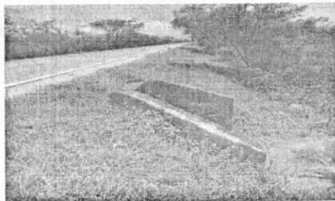
VIA SAN JUAN DEL CESAR – VALLEDUPAR (PR 68+140)