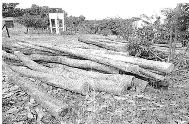
Producto descargado en el predio río claro en el momento de entrar al CAV