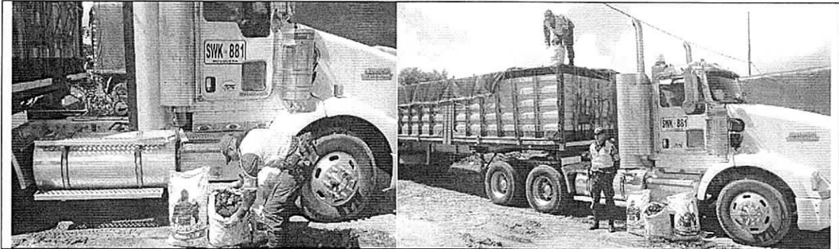
Decomiso de carbón vegetal en el momento de la incautación