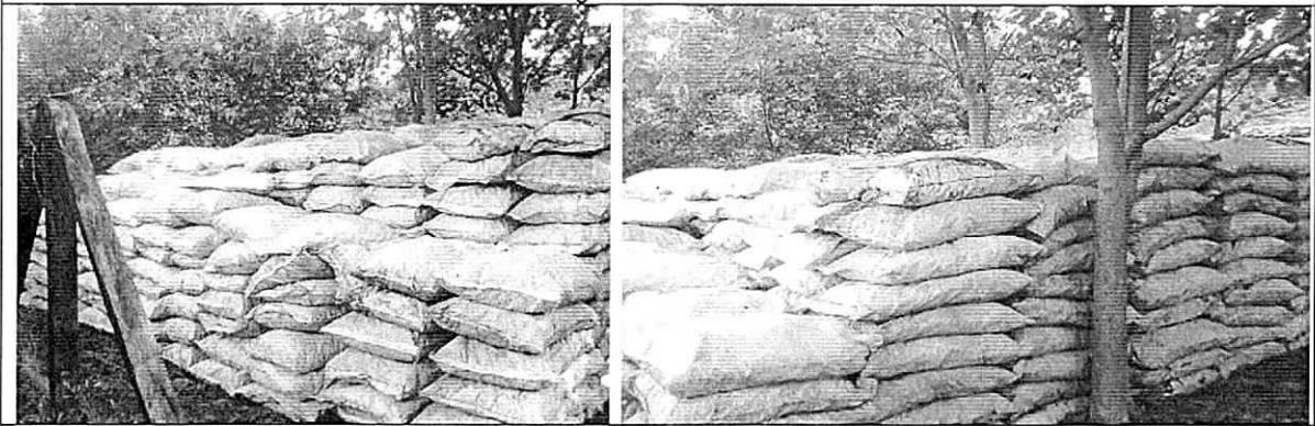
Decomiso de carbón vegetal dejado en el predio rio claro